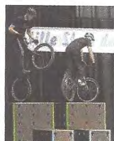
Bike-Trail-Show vom ASC Göttingen.