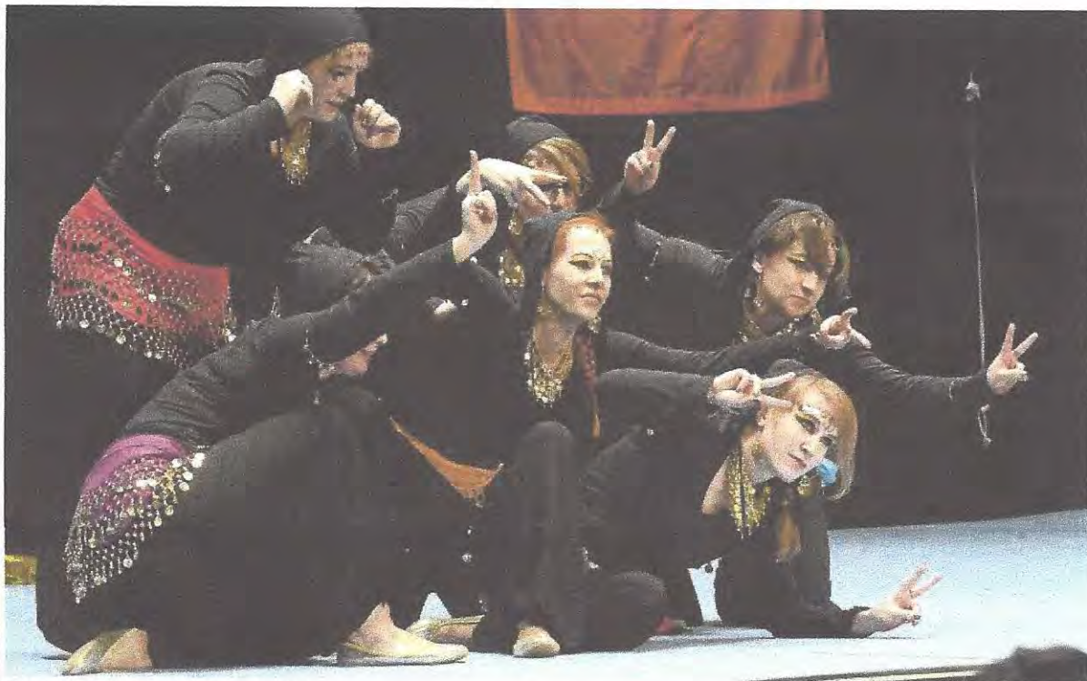
Die Hell's Belles von der TG Lapelka vertreten den Altkreis Osterode.