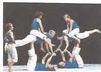
Kaz-Akkrobatik aus Göttingen.