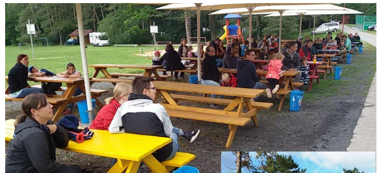
Jede Familie hatte einen Tisch